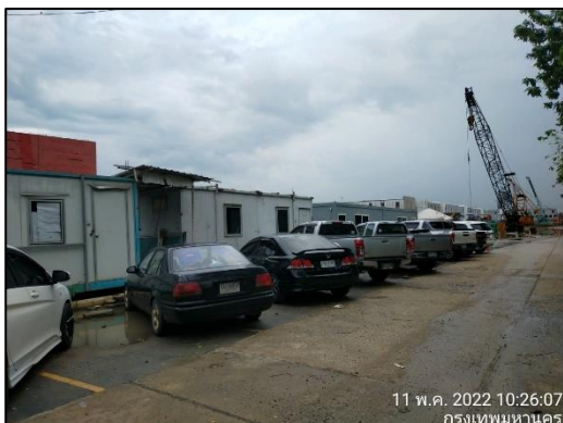
ภาพที่ 4 พื้นที่จอดรถภายในโครงการ