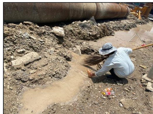
ภาพที่ 17 กิจกรรมฉีดพรมน้ำและทำความสะอาดพื้นที่โครงการ