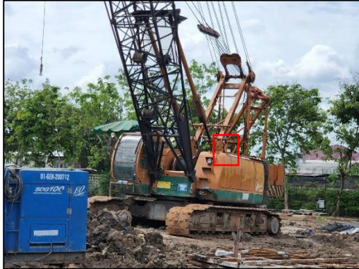
ภาพที่ 12 สัญญาณไฟกระพริบบริเวณเครน