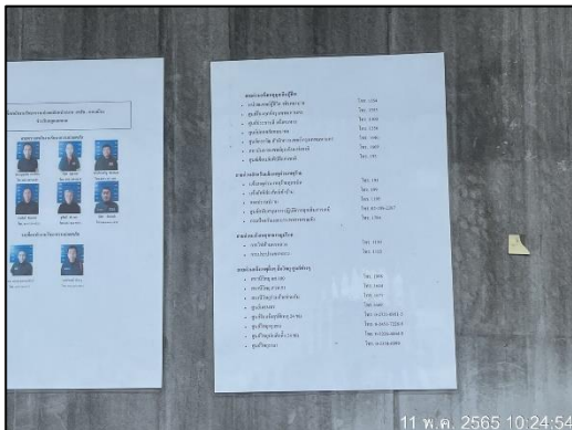
ภาพที่ 2 เบอร์โทรศัพท์ฉุกเฉิน