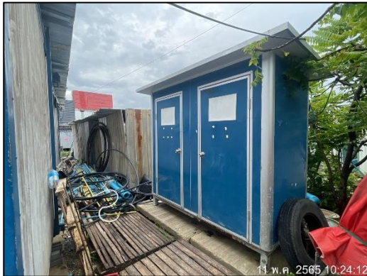
ภาพที่ 35 ห้องน้ำ-ห้องส้วมคนงาน