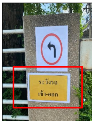
ภาพที่ 39 ป้ายระวังรถบริเวณด้านหน้าโครงการ