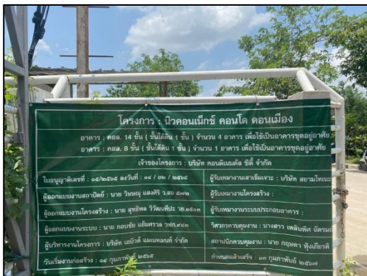
ภาพที่ 37 ป้ายรายละเอียดโครงการ