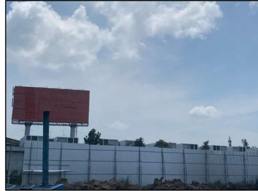
ภาพที่ 1 รั้ว Metal Sheet สูงขนาด 6 เมตร