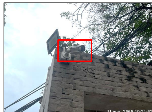
ภาพที่ 40 กล้องวงจรปิด