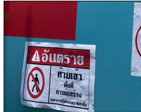
ภาพที่ 36 ป้ายแสดงเขตพื้นที่ก่อสร้าง