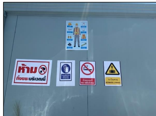
ภาพที่ 28 ป้ายเตือนอันตราย