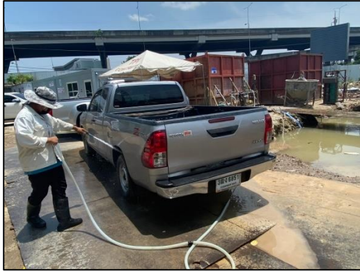
ภาพที่ 15(ต่อ) พื้นที่ล้างล้อรถ/กิจกรรมฉีดล้างล้อรถบรรทุก