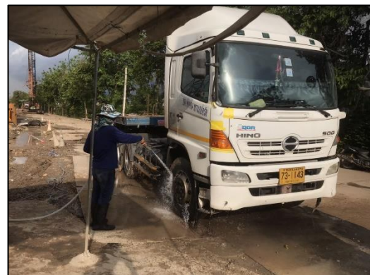
ภาพที่ 15 พื้นที่ล้างล้อรถ/กิจกรรมฉีดล้างล้อรถบรรทุก