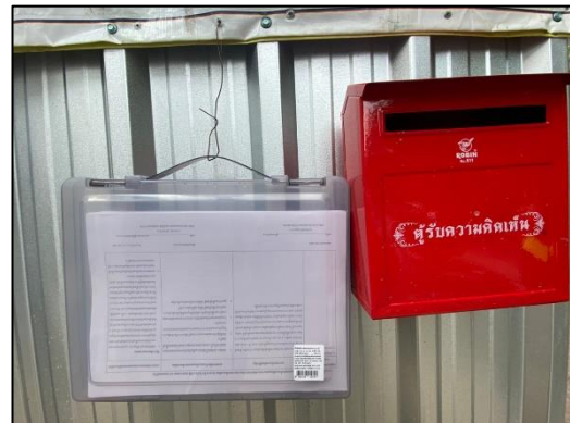
ภาพที่ 3 กล่องรับเรื่องร้องเรียน