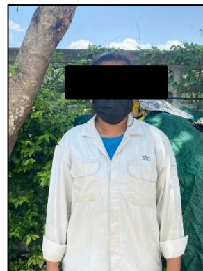
ภาพที่ 38 ชุดฟอร์มคนงาน