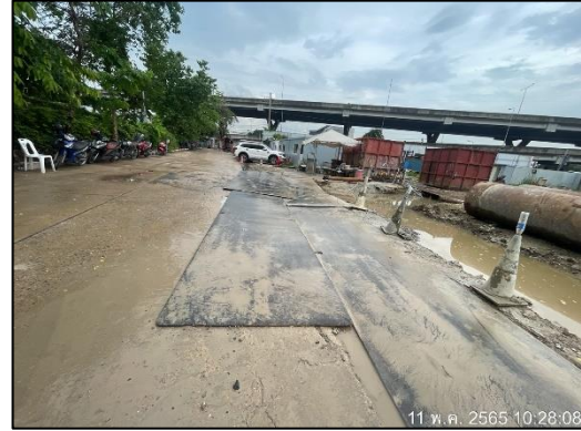
ภาพที่ 25 ปูแผ่นเหล็ก