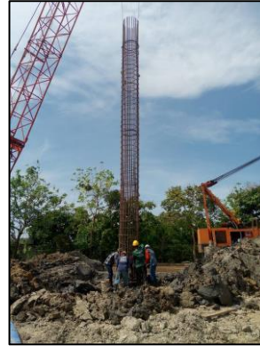
ภาพที่ 16 เสาค้ำเข็มเจาะ