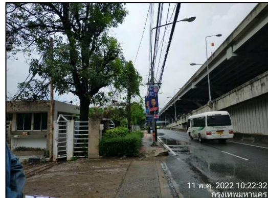
ภาพที่ 14 ถนนบริเวณด้านหน้าโครงการ