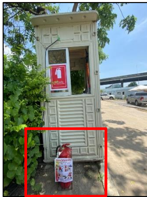
ภาพที่ 26 ถังดับเพลิง