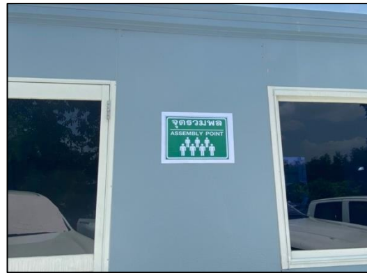
ภาพที่ 27 จุดรวมพล