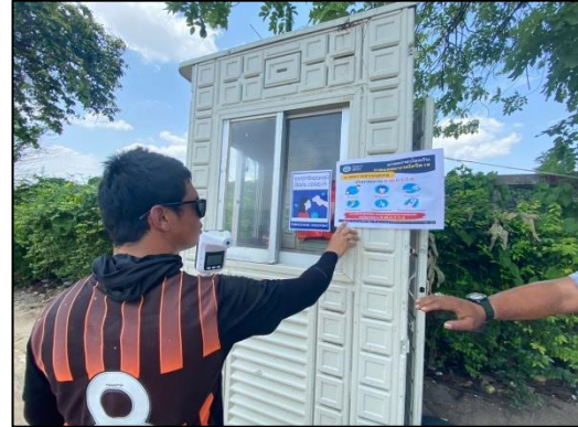
ภาพที่ 47 จุดคัดกรองโรงไวรัส COVID-19