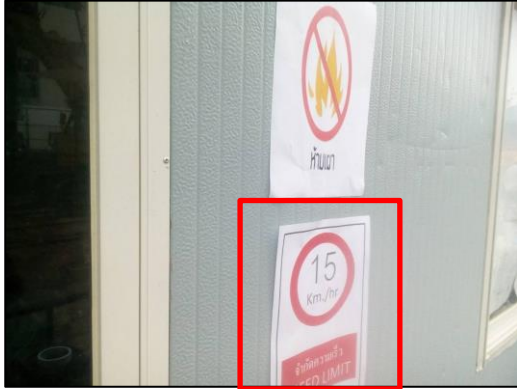
ภาพที่ 24 ป้ายจำกัดความเร็ว