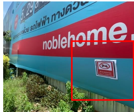
ภาพที่ 5 ป้ายห้ามจอดรถบริเวณด้านหน้าโครงการ